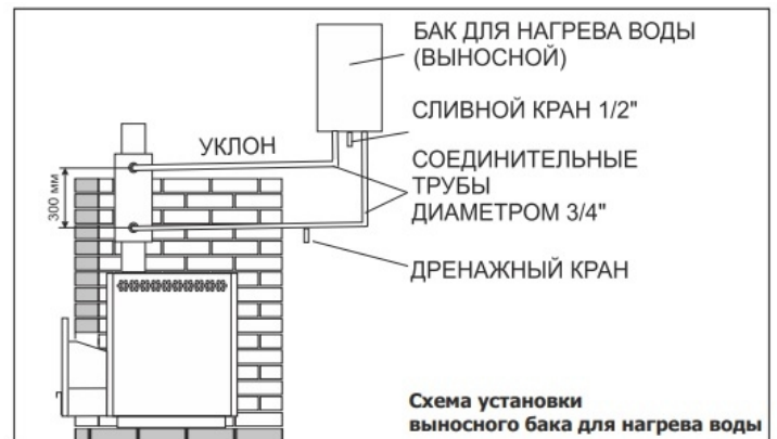
Рис.2 Схема монтажа бака

1 — Корпус бака; 2 — Крышка; 3 — Кронштейн крепления; 4 — Штуцер G 3/4", 5 — Штуцер G 1/2"